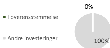
1. Investeringer i overensstemmelse med klassificeringssystemet, inkl. statsobligationer*